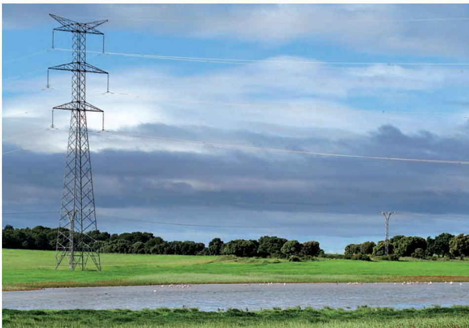
Foto 1. Tendido eléctrico de transporte que atraviesa la Laguna de Casa Palomera (Chinchilla de Montearagón, Albacete). En el humedal, varios grupos de flamencos comunes.