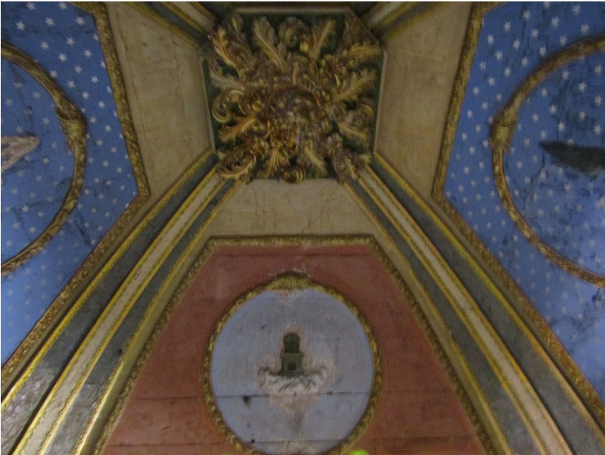
Figura 3: Pinturas decorativas del camarín de la capilla del Espino y florón de madera actuando de clave, c. 1756, parroquia de Santiago (Liétor).