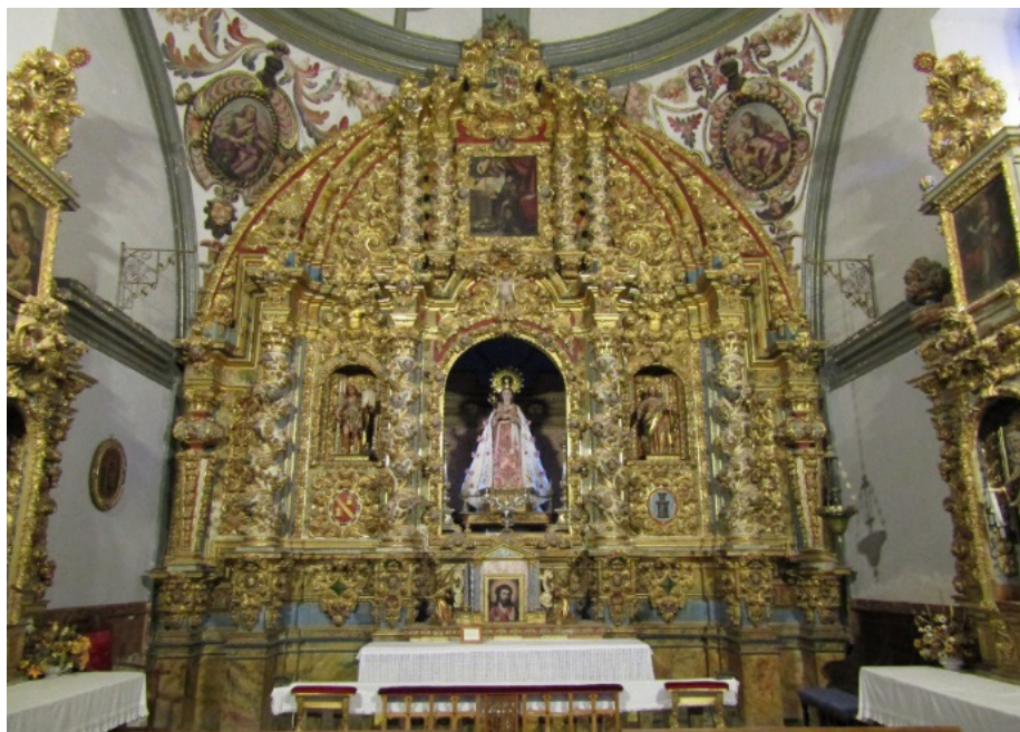
Ilustración1: Retablo de la Capilla de Nuestra Señora del Espino, 1731, parroquia de Santiago (Liétor).